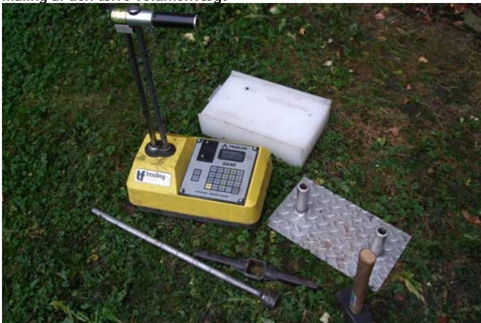
Udstyret til en isotopsondemåler 3440 fra firmaet Troxler indeholder blok til kalibrering, plade med bøsningrør til nedramning af mejsel forud for instrumentets anvendelse.

I dag er det muligt at måle den volumenvægten med en isotopsonde. Instrumentet fra firmaet Troxler er det mest udbredte. Isotopsondemåleren måler den våde volumenvægt og vandindholdet og trækker de to værdier fra hinanden, hvorefter den tørre volumenvægt kommer frem. Tidligere havde man metoder, hvor man kombinerede prøver fra marken og laboratorieundersøgelser, og resultater tog op til et døgn.